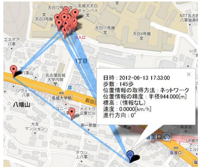
Fig.1. Position information from network

TLIFES ユーザが多く利用する屋内施設として、スーパーマーケット、病院、スポーツジム、学校や地下鉄などが考えられる。このような場所では会員証や電子マネー、定期券などを利用する機会が多く、今後は非接触 IC カード、特に NFC の利用が期待されている。そこで、NFC が広く利用されていることを想定して、TLIFES 利用者の屋内位置検出について検討した。Fig.2.にシステム構成を示す。前提として、TLIFES 利用者のスマートフォンには、NFC 機能が搭載されているものとする。また、NFC のリーダーライターは PC と接続し、PC に緯度、経度、施設名等の位置情報を登録してあるものと